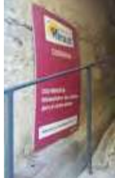
Réhabilitation des calades de Cesseras