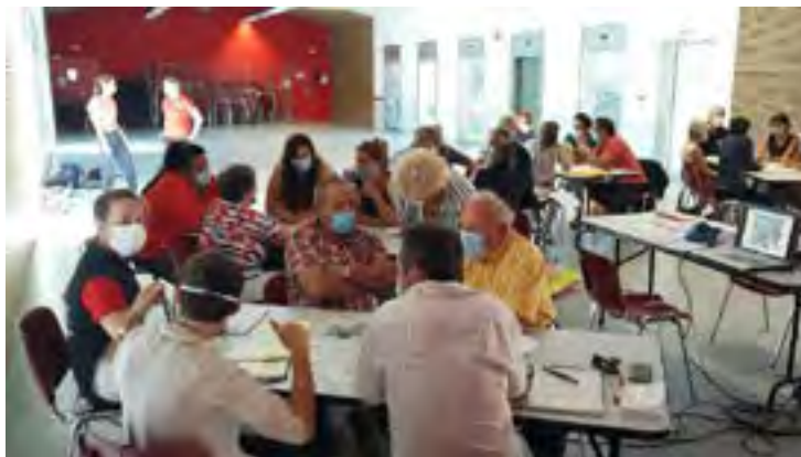
Groupe de travail du Plan de paysage du 3 septembre à La Caunette