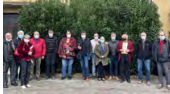
Comité des élus du 16 décembre à La Livinière