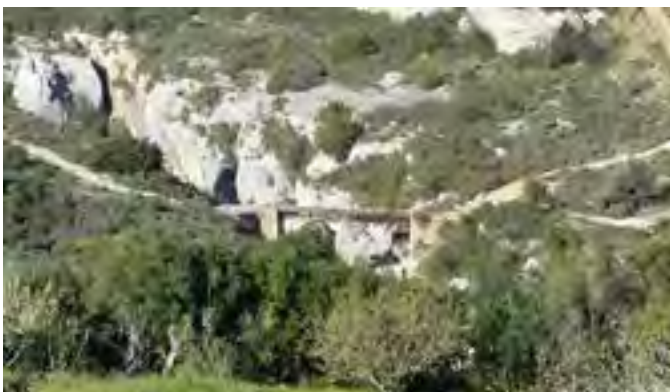
Passerelle de Coupiac entre Minerve et La Caunette