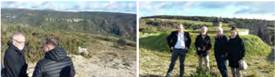
Visites de terrain avec l'Inspecteur général à Fauzan puis à Minerve

Suite à cette inspection, et après plusieurs temps préalables de préparation :