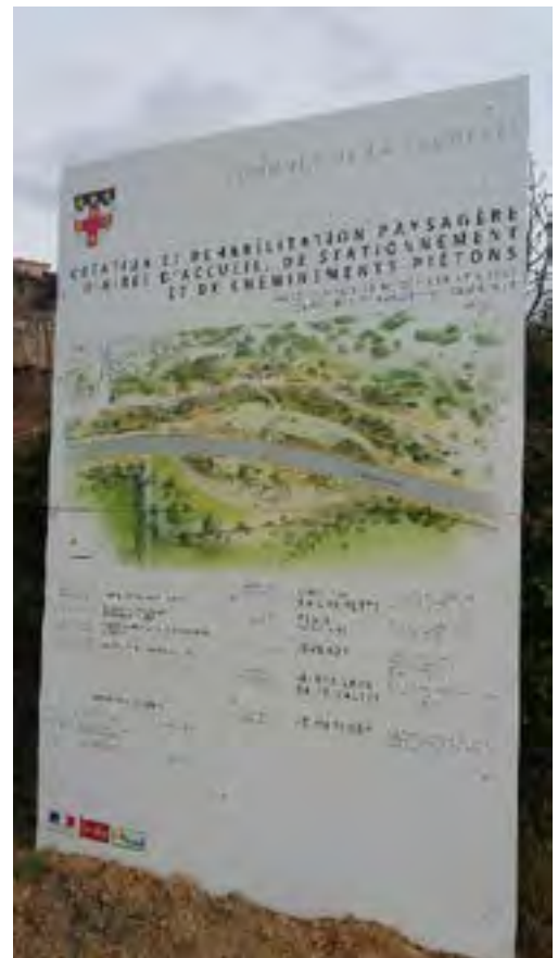
Aménagement d'un cheminement piétons et d'une aire d'accueil visiteurs à La Caunette