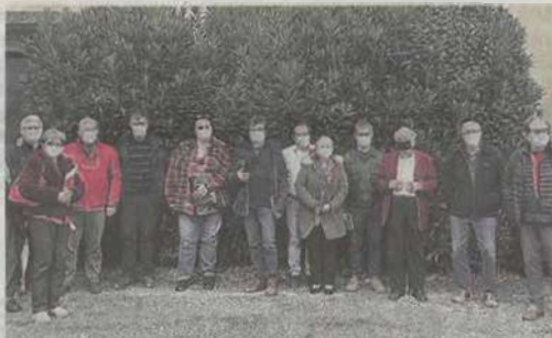
Un point d'étape a été présenté lors de la réunion du Comité.

été fait sur l'avancement des opérations. Parmi celles-ci, on peut noter le lancement par le Pays de deux appels d'offres en vue d'élaborer un schéma de