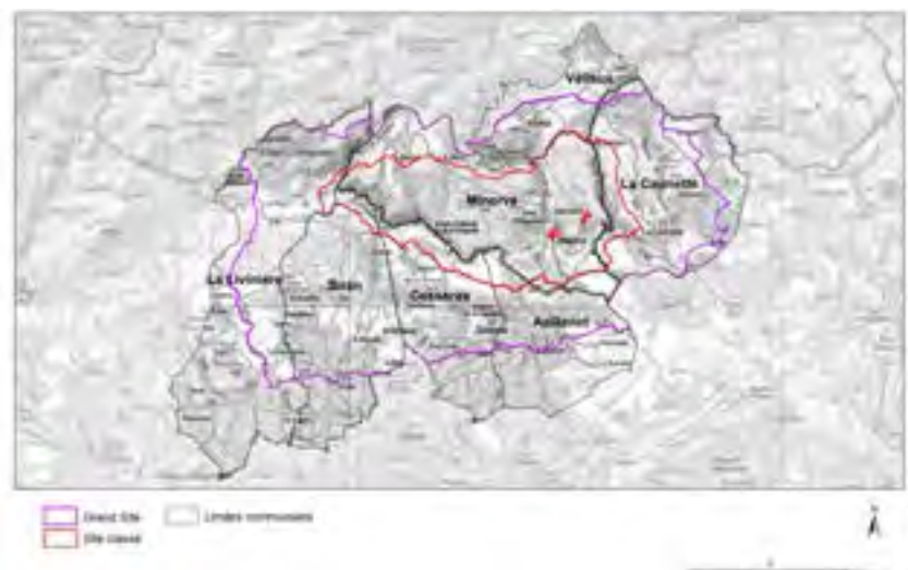
Périmètre du Grand Site