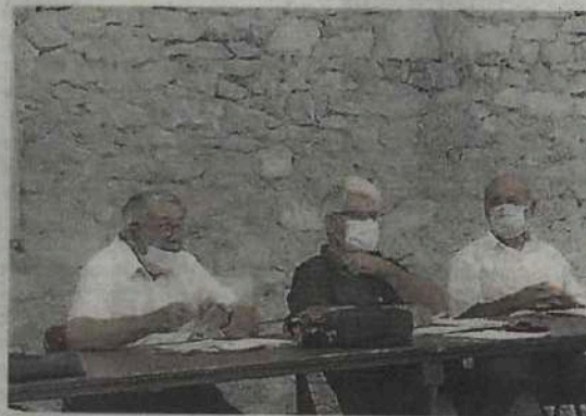
Une démarche de préservation, gestion et mise en valeur du territoire.

La réunion avait pour objet de se redire collectivement les fondamentaux de cette démarche de préservation, gestion et mise en valeur et de préparer le travail des mois à venir.