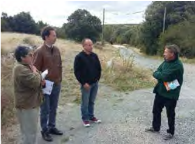
Réunion de lancement du projet à Vélioux du 2 Octobre