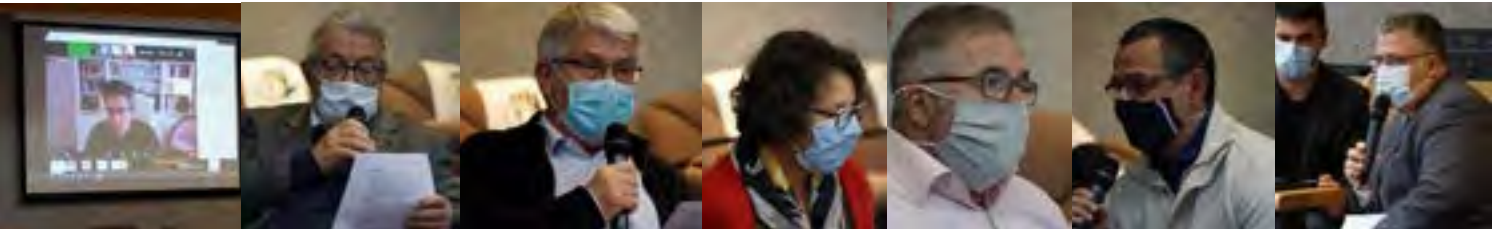
Audition devant la Commission Supérieure des Sites en visioconférence