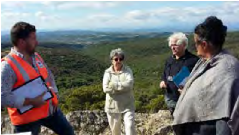
Visite de terrain avec l'Agence technique départementale du Haut-Languedoc du 17 juillet à Vélioux