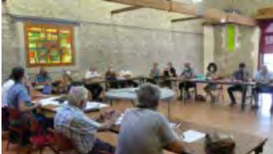
Comité des élus du 29 juillet à Cesseras