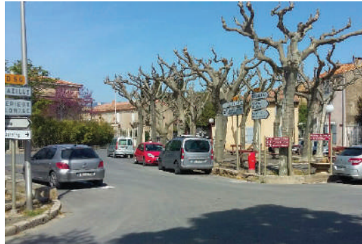
Restitution de l'inventaire des collections du musée le 29 juin à Minerve © S. Brisa Espace dit "de la promenade" à Siran © S. Brisa