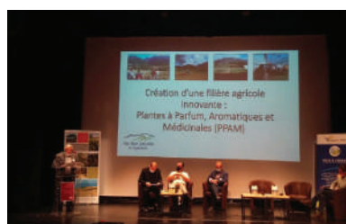
Intervention sur les PPAM lors des rencontres annuelles des Grands Sites de France le 7 octobre à Gignac