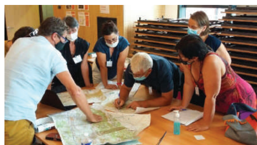
Séminaire technique sur le projet Escapade Nature Sans Voiture inter Grands Sites le 30 juin à Carcassonne