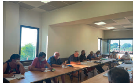
Comité des élus du 1er septembre à Vélieux