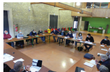
Comité des élus du 19 mai à Cesseras