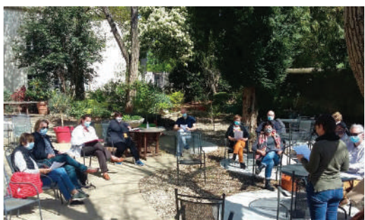
Groupe de travail ambassadeurs de l'OT du Minervois au Caroux le 30 mars à Siran