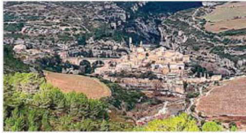
Minerve vue depuis le belvédère de la Pujade.

À titre d'exemple, l'aménagement viticole sur les communes de Cesseroas, La Livinière et La Caunette sont des actions de