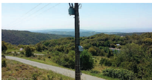
Panorama vers le sud depuis Vélioux