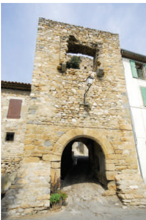
Porche à la Caunette