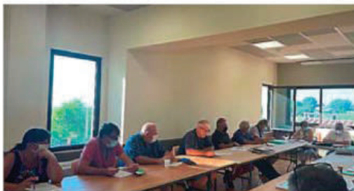
Les élus ont repris leurs réunions, début septembre.

Le comité des élus de l'opération Grand Site (OGS) Cité de Minerve, gorges de la Cesse et du Brian, a repris ses réunions début septembre dernier à Vélioux. Lors de cette réunion à laquelle participaient tous les élus des communes concernées et de la communauté de communes du Minervo au Caroux, Jean Arcas, président du Pays Haut-Languedoc et vignobles, est revenu sur la saison estivale. Les villages et les sites patrimoniaux naturels et culturels de l'ouest de l'Hérault ont connu une fréquentation accrue par rapport à 2020. Cela a généré de nouvelles retombées économiques mais a mis également en