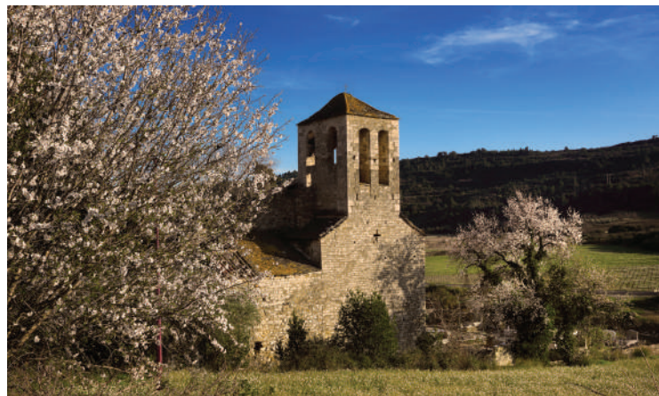
Eglise ND de l'Assomption à la Caunette