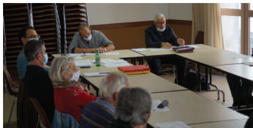
Comité des élus du 6 mai à Azillanet