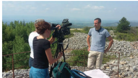
Tournage par France 3 sur le site des Meulières le 10 juin à La Livinière

— Plan de communication de l'Opération Grand Site (élus, habitants) : poursuite de la diffusion de communiqués de presse et de posts facebook, accueil d'une équipe de France 3 Occitanie à Minerve et La Livinière en juin, présentation d'un projet de plan d'actions et d'outils devant le comité des élus en juin.