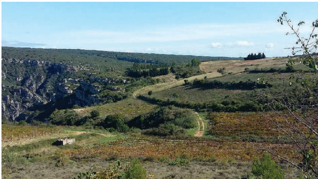
Paysages agricoles autour de Fauzan