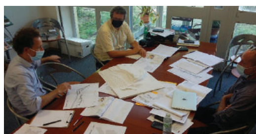
Réunion technique sur le projet aire d'accueil et d'information du 29 septembre à Saint-Chinian