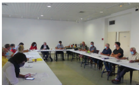
Comité des élus du 29 juin à Siran