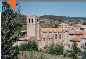
Au cœur du village

Située au nord-ouest du village, elle est citée dès 844. Remplacée par une église romane puis par l'édifice actuel de style gothique tardif (fin XVe et première moitié du XVIe). Son chœur est voûté d'ogive à sept pans. La nef comporte cinq travées. Cinq chapelles et un porche s'insèrent entre de puissants contreforts. Le clocher crénelé est une forte tour carrée du XIIIe, seul élément conservé de l'église romane. Visite accompagnée sur rdv à prendre au moins une semaine à l'avance en mairie.